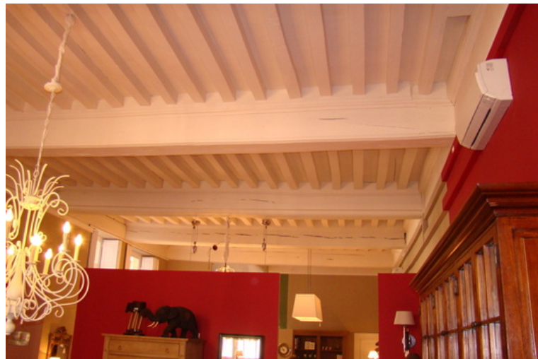
08.3.1 - 2 Prachtig, zo'n oud plafond à la Française!

Bij grote overspanningen werden vaak moerbalken en kinderbinten toegepast, les plafonds à la Française , zie afb.2, een tot winkel verbouwd herenhuis. Grote balken van behoorlijke afmetingen, soms tot 30x45cm (B x H), liggen dwars door de kamer, en hierop of hierin ingekeept de kinderbinten met veel geringere afmetingen. Dit door een eronder gehangen gipsplatenplafond te verbergen is zonde; hier helpt alleen een complete revisie in oude stijl - hierop kom ik later nog eens terug.