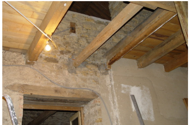
afb.08.3 - 1 Plafond = zoldervloer

In veel traditionele landelijke huizen vindt men, vooral tussen bovenverdieping en zolder, gewoon planken op de verdiepingsbalken, zie afb.1. Deze planken zijn dus tegelijkertijd vloer voor de zolder en plafond voor de eronder liggende vertrekken. In oudere huizen zijn dit gewone planken, maar bij alles wat jonger dan rond zestig jaar is vindt men doorgaans planken met messing en groef. Natuurlijk zijn de gewone plankenvloeren nooit dicht, en die met messing en groef ook alleen als de kieren niet door krimp van de planken open staan. U begrijpt dat de isolatiewaarde van deze plankenvloeren uiterst gering is – vroeger moest de isolatie van hooi en andere landbouw-producten komen die op de