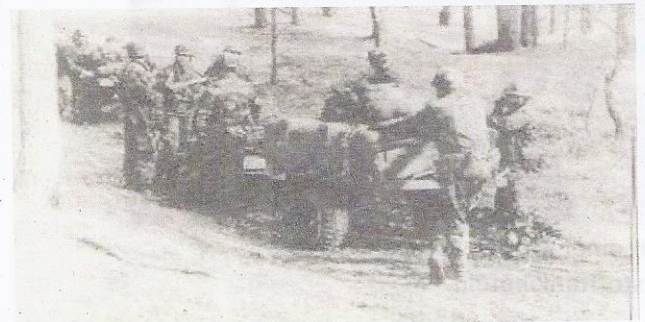
In Bereitschaft (PzAbw)