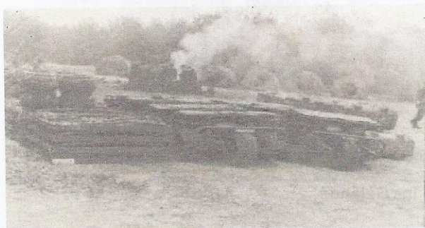
Die AS neben ihren Anhängern.